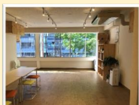
基礎課程天神校 定員10名

自立した日常生活を営むために必要な訓練と、生活等に関する相談および助言などの支援を行います。