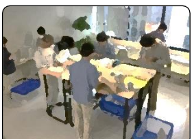
せいさんかつどう 生産活動