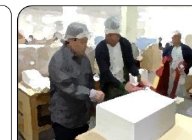
しょうくばほうもん 職場訪問