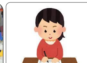
おうぼしよるいさくせい 応募書類作成