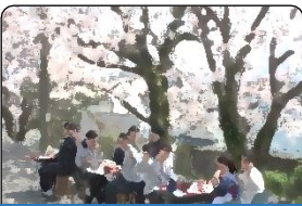
コミュニケーション