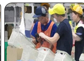
きぎょうじっしゅう 企業実習