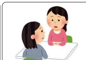
そうだんしえん 相談支援