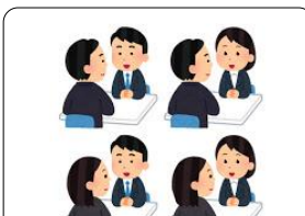
めんせつれんしゅう・どうこう 面接練習・同行