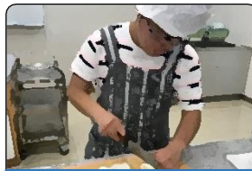
せいかつぎじゅつ 生活技術