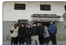
さたてい すたてい Saturday Study