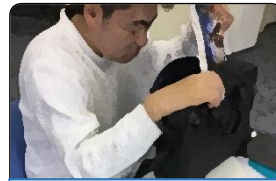
そうごうじっせん 総合実践