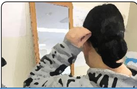
けんこう えいせい 健康・衛生