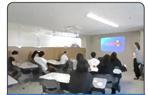
ごとうどう 合同セミナー