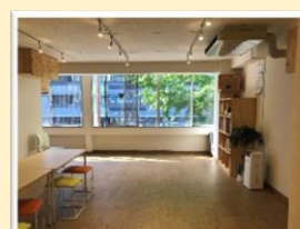
専門課程天神校 定員10名

企業就労に必要な知識、能力を養い職場実習等を通して本人の適性に見合った職場への就労と定着を目指します。