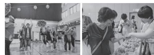
なのみ学園おどり隊

8月28日(日)に福岡市南区清水町内の4施設合同で「第19回清水ふれあいまつり」が開催されました。なのみ学園の保護者や関係者・住民の方など多くの方が来場されました。利用者の方はそれぞれ催し物の担当を持ち、もてなす側として活躍されました。また、障がい者スポーツセンターのメインステージではなのみ学園おどり隊による踊りを披露しましたが、1ヶ月間の練習の成果が十分に発揮され、利用者さんも大変楽しんで頂けました。(福岡市立なのみ学園 大本 梓織)