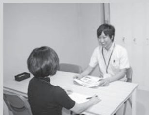
親身になってご相談に乗ります

【連絡先】 (TEL) 092-729-9987 (ののはな) (FAX) 092-717-9988