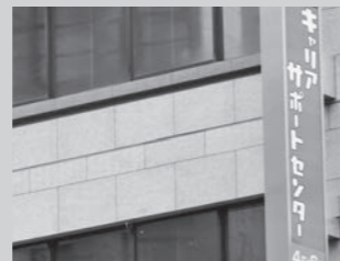
キャリアサポートセンターが目印です