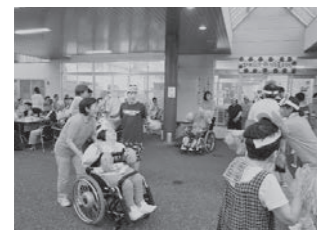
「エビカニクス」で踊っちゃおう!