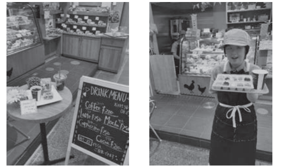
いらっしゃいませー!

少しずつですが、常連のお客様も増えています。店先でお客様とお話することも喜びの1つです。商店街の方も声をかけてくださったり、保護者の方も近くまで来たので・・・と寄っていただいたり、みなさまに支えられています。現在、月、火の2日間ですが、利用者みなさんが交替で販売活動に参加しています。商店街に元気な呼びかけが響いています。ぜひ、近くにお越しの際はみなさまのご来店をお待ちしております。 (福岡市立なのみ学園 小川 美佐)