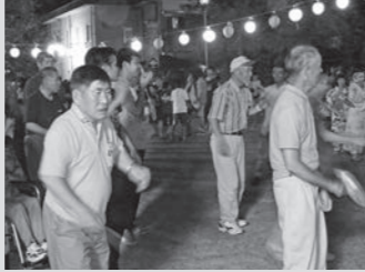
みんなで一緒に「炭坑節」♪

8月18日(木)、今津福祉村納涼盆踊り大会が松濤園中庭で行われました。利用者みなさんが毎年楽しみにしている夏の行事ですが松濤園最後の盆踊りになりました。ジュースや綿菓子などを食べ、ステージでの催し物を楽しみました。また最後には日中活動の合間に練習した「炭坑節」を地域の方と一緒に踊りました!!利用者さんの最高の笑顔で今年の夏も終わり、良い思い出となりました。 (第一野の花学園 佐々木 萌)