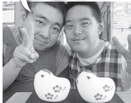
かわいい酉の干支置物が完成しました