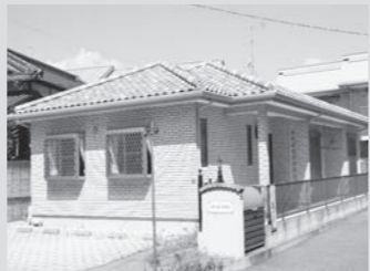
安全と安心と安らぎを!