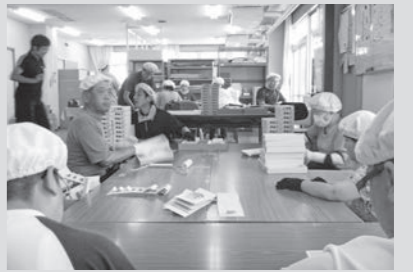
有名店の箱折り!責任重大!

福岡市東区に障がい者の方が通うふよう学園があります。その中の簡易班の作業内容は、お菓子の箱折りで、福岡県のお土産で有名なお菓子やめんたいなどの箱を利用者16名で1日約3,000個組み立てます。組み立て・トレー入れ・点検など工程を細かく分け一工程につき一人が責任を持って作業します。利用者の方に作業の方法を分かりやすく伝え、「安全に」「効率良く」「集中して」多くの箱を完成させます。楽しさややりがいを感じていただけるように努めています。8月より「玉露まんじゅう」が新しく加わり忙しい日々が続いていますが、利用者・職員共に楽しみながら丁寧な箱作りに取り組んでいます。 (福岡市立ふよう学園 中橋 薫)